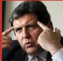
ALAN GARCIA (Presidente de la República 2006 -2011)

"Solamente personas enfermas pueden tirar sobre mi vida la porquería de su alma, personas que creen que todo ladrón son de su misma condición. No comprenden el honor histórico de representar al país y creen que por hacerle bien a pobres que necesitan una segunda oportunidad y les reducen la pena, hay detrás unos centavos"