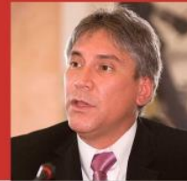
AURELIO PASTOR Ministro de Justicia julio 2009 - marzo 2010

"A mí me da vergüenza lo que ha pasado. Se lo digo sinceramente. El señor Facundo Chinguel está separado del partido. Estamos a la espera de la investigación fiscal y judicial para tomar decisiones. Pero no voy a avalar de ninguna manera hechos que son francamente vergonzosos"