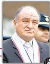
Roberto Torres Gonzales Alcalde de Chiclayo (Detenido)